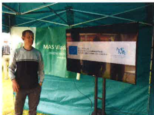
Radonické májové slavnosti

MAS Vladař se tradičně zúčastnila a propagovala svou činnost, územní partnery i aktivní subjekty na Radonických májových slavnostech, probíhajících každoročně 1. května. Hlavním pořadatelem této akce je Občanské sdružení Naše Radonicko .