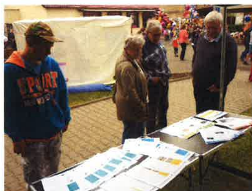
Radonické májové slavnosti