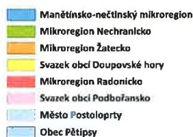
Území působnosti MAS Vladař 2014 - 2020

MAS Vladař působí na území 53 měst a obcí: Žatec, Rokle, Chbany, Radonice, Mašťov, Vilémov, Veliká Ves, Libědice, Bitozeves, Blažim, Čeradice, Deštnice, Holedeč, Lenešice, Liběšice, Libočany, Libořice, Lišany, Měcholupy, Nové Sedlo, Staňkovice, Tuchořice, Výškov, Zálužice, Žíželice, Lubenec, Krásný Dvůr, Podbořanský Rohozec, Nepomyšl, Podbořany, Blšany, Očihov, Kryry, Vroutek, Petrohrad, Blatno, Žlutice, Toužim, Štědrá, Andělská Hora, Pšov, Chyše, Čichalov, Verušičky, Valeč, Vrbice, Manětín, Nečtiny, Štichovice, Kadaň, Postoloprty, Račetice, Pětipsy.