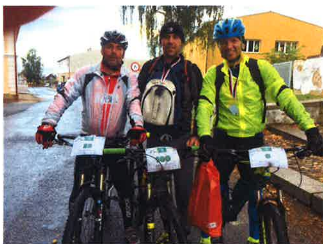
Benefiční závod John's bike

V září zorganizoval Okrašlovací spolek Budiček ve Vrutku čtvrtý ročník benefičního závodu kol a koloběžek. Výtěžek 5.300 Kč byl použit na opravu místních památek. MAS Vladař se zde prezentovala propagačními materiály a zaměstnanci MAS dobrovolnický pomáhali.